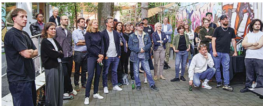
Bestaunten den PurplePark-Film.