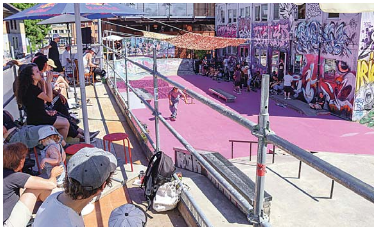
Der Purple Park, mit einer der besten Skateboardanlagen der Stadt, feierte am vergangenen heissen Wochenende mit einem fulminanten Fest mit verschiedenen Wettkämpfen sein 40-jähriges Bestehen.

Man kann sich in dieser Basler Stadtoase nicht nur bewegen, tanzen und skaten, man kann sich auch vom Schul- und Ausbildungs-