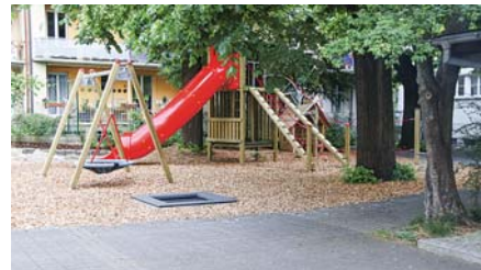
Am Sonntag, 21. Juni, findet ab 10.30 Uhr die Einweihung des neuen Kinderspielplatzes statt: zuerst in der Kirche, anschliessend Einsegnung und Grill für alle.