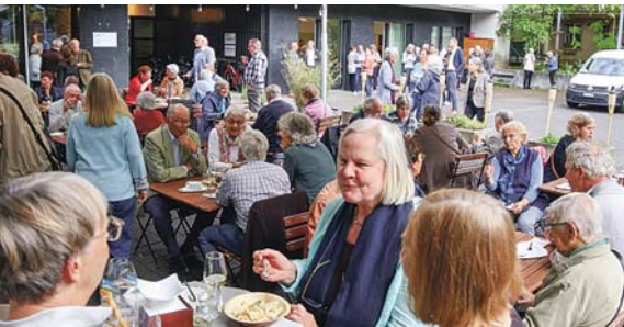
Beliebt bei den Genossenschafter:innen: der Apéro vor der GV im Hof des L'Esprit.