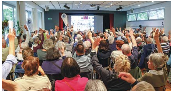
Was alles beschlossen wurde, erfahren Sie in der nächsten Ausgabe.